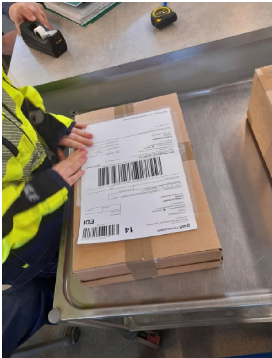
Postipakettiin liimataan postituslappu.