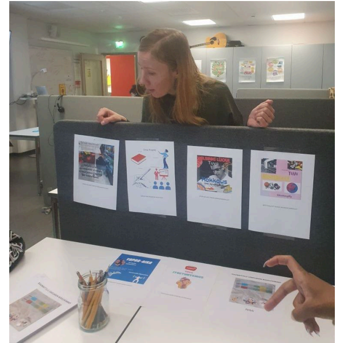
TUVA opettaja kertoi tutustujille TUVA opinnoista.

AmisMaistis koostui tutustumispäivästä sekä etäyhteistyöstä. Oppilaat pääsivät käytännössä tutustumaan eri alojen työtehtäviin ja TUVA opiskeluun käytännön tehtävien avulla yhdessä toisen asteen opiskelijoiden kanssa. Opetus- ja ohjaushenkilöstölle tarjoutui mahdollisuus tutustua alojen työtehtäviin yhdessä oppilaidensa kanssa ja keskustella oppilaitoksen henkilöstön ja opiskelijoiden kanssa vaativan erityisen tuen koulutusten toteuttamisesta ja saada tietoa ohjaustyönsä tueksi.