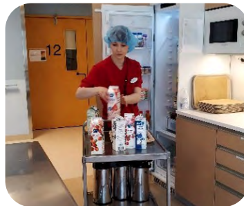
Ansku Pirkanmaan hoitokodilta ateriahuollon palvelutehtävissä