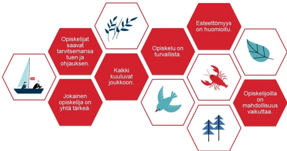
Kuva 2: Opiskelijoiden ajatuksia tasa-arvon ja yhdenvertaisuuden toteutumisesta Luovissa

Tasa-arvo- ja yhdenvertaisuuskaudella 2022–2025 toteutettiin myös kattava opiskeluhyvinvoinnin työpajakiertue, joka järjestettiin Luovon 11 paikkakunnalla. Työpajat oli suunnattu sekä opiskelijoille että henkilöstölle. Yksi keskeisistä työpajateemoista oli tasa-arvon ja yhdenvertaisuuden nykytila sekä näiden osa-alueiden kehittäminen. Työpajojen tuloksena kehittämiskohteiksi nousivat seuraavat osa-alueet: