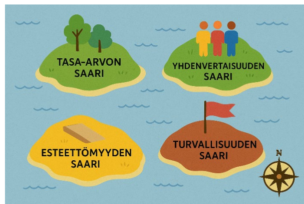
Kuva 3: SEPPO-pelin näkymä opiskelijoiden työpajoissa

Tasa-arvo- ja yhdenvertaisuussuunnitelman laadinta aloitettiin kattavalla nykytilanteen kartoituksella kaikilla Luovin toiminta-alueilla. Toteutustavaksi valittiin toiminnalliset opiskelijatyöpajat, jotka järjestettiin yhteistyössä opiskelijoiden ja henkilöstön kanssa eri paikkakunnilla. Työpajojen toteuttamista varten laadittiin SEPPO-peli, johon opiskelijat osallistuivat 3–5 hengen ryhmissä. Peli sisälsi monivalintakysymyksiä tasa-arvo- ja yhdenvertaisuustilanteesta sekä tiimitehtäviä, joissa opiskelijat ideoivat tulevalle suunnittelukaudelle soveltuvia tasa-arvoa ja yhdenvertaisuutta edistäviä toimintamalleja ja menetelmiä. SEPPO-pelin jälkeen kokemukset käsiteltiin paikallisissa työpajoissa, ja niistä muodostettiin Luovi-tasoinen yhteenveto, johon koottiin tasa-arvo- ja yhdenvertaisuustoiminnan vahvuudet ja kehittämiskohteet kaudelle 2026–2029.