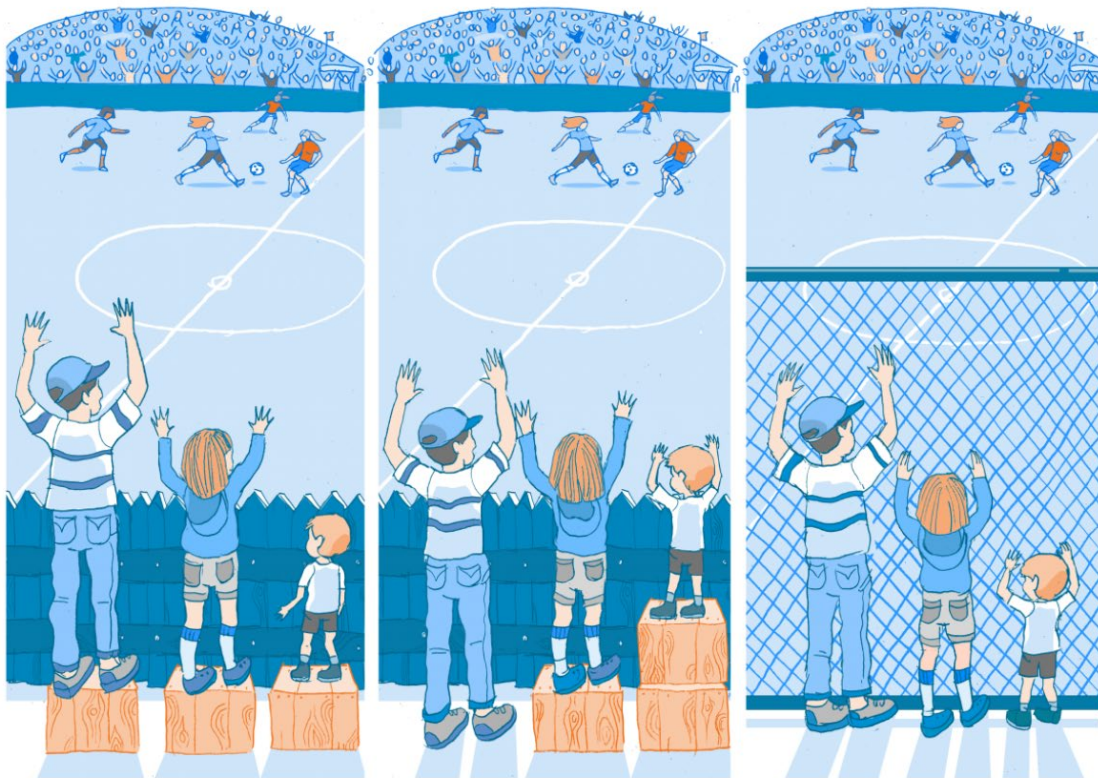
Kuva 1: Mitä syrjintä on ja mitä se ei ole (Unicef materiaalipankki:

Yhdenvertaisuus on tukea tai esteiden poistoa